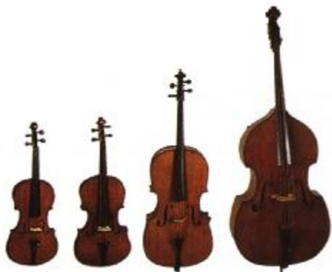
VIOLÍ VIOLA VIOLONCEL CONTRABAIX

La família de la corda fregada està integrada per 4 components: violí, viola, violoncel i contrabaix; les cordes es freguen amb un arquet. Abans de començar a tocar, l'interpret posa tibans els crins de cavall fent girar el cargol i els impregna amb una mena de resina que els dona adherència. Per tocar mou l'arquet amb la mà dreta a fi que els crins freguin les cordes. Cap d'aquests quatre instruments no té trastos al batedor, per això l'interpret ha de ser molt precís a l'hora de prémer les cordes amb la mà esquerra (una variació d'un mil·límetre en la posició d'un dit suposa emetre una nota desafinada!)