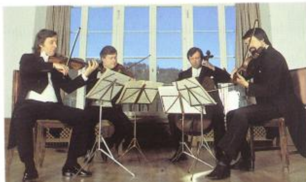
El quartet de corda és format sempre per 2 violins una viola i un violoncel.

El quartet de corda que es podrà escoltar i veure a través de la pantalla, gràcies als músics virtuals és un conjunt instrumental format per dos violins, una viola i un violoncel. Les obres que el músic del s. XVIII F.J. Haydn compongué per a aquesta agrupació convertiren el quartet de corda en un gènere ben caracteritzat, amb una gran personalitat pròpia. Juntament amb W.A. Mozart i L. van Beethoven en feren la forma més exigent i representativa per a compositors, intèrprets i oients de música de cambra. La música de cambra originàriament era la música que s'interpretava a la "cambra" o habitacions dels prínceps, en contraposició a la música domèstica de la burgesia o a la música religiosa, teatral i a l'aire lliure. Actualment s'entén per música de cambra la música instrumental per a petits conjunts (generalment entre 2 i 9 instruments).